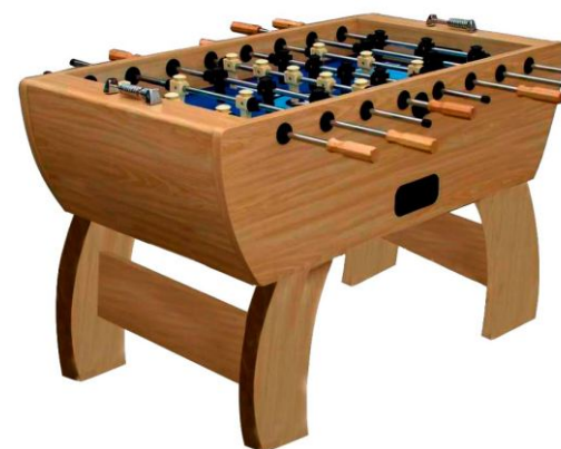
Настольный футбол «Royal»

Артикул: 51.169.05.5 Жетоноприемник: нет Габариты: 146 x 78 x 90 см Вес: 108 кг