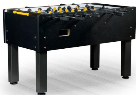
Настольный футбол «Marsel»

Артикул: 51.129.05.1 Габариты: 144 x 76 x 90 см Жетоноприемник: нет Вес: 113 кг