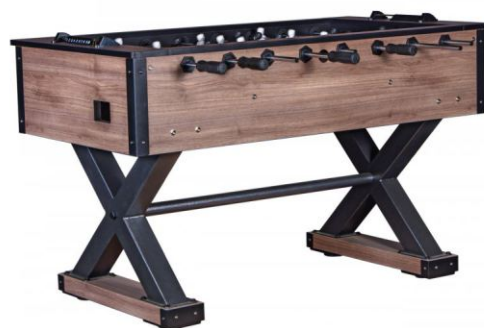
Настольный футбол «Tournament Pro»

Артикул: 51.125.05.0 Жетоноприемник: нет Габариты: 145,7 x 75 x 91 см Вес: 62 кг