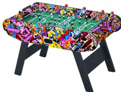
Настольный футбол «Leon»

Артикул: 51.136.05.1 Жетоноприемник: нет Габариты: 160 x 82 x 38 см Вес: 70 кг