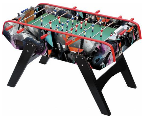
Настольный футбол «Glasgow»

Артикул: 51.136.05.1 Жетоноприемник: нет Габариты: 160 x 82 x 38 см Вес: 70 кг