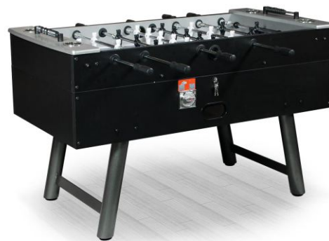
Настольный футбол «Madrid»

Артикул: 51.129.05.1 Габариты: 144 x 76 x 90 см Жетоноприемник: нет Вес: 113 кг