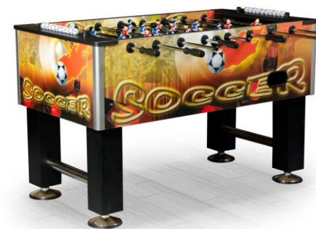
Настольный футбол «Roma II»

Артикул: 51.136.05.3 Жетоноприемник: нет Габариты: 147 x 73 x 88 см Вес: 39 кг