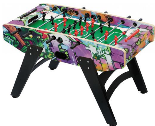
Настольный футбол «Lazio»

Артикул: 51.125.05.0 Жетоноприемник: нет Габариты: 145,7 x 75 x 91 см Вес: 62 кг